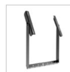
Kit torre faro extra LKITA00000000101