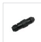
Connettore rapido IP 2 poli LKITA00000000017