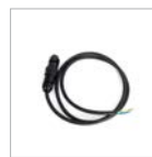
Cavo con connettore Ca. 2m, Con. 2 poli LKITA00000000040 Ca. 2m, Con. 3 poli LKITA00000000041