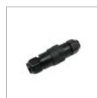
Connettore rapido IP 2 poli LKITA00000000017