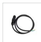
Cavo con connettore Ca. 2m, Con. 2 poli LKITA00000000040 Ca. 2m, Con. 3 poli LKITA00000000041