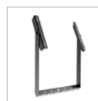
Kit torre faro extra LKITA00000000101