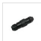
Connettore rapido IP 3 poli LKITA00000000003