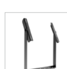
Kit torre faro extra LKITA00000000101