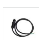
Cavo con connettore Ca. 2m, Con. 2 poli LKITA00000000040 Ca. 2m, Con. 3 poli LKITA00000000041