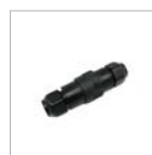
Connettore rapido IP 2 poli LKITA00000000017