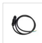
Cavo con connettore Ca. 2m, Con. 2 poli LKITA00000000040 Ca. 2m, Con. 3 poli LKITA00000000041