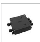
Kit scatola di derivazione LKITA00000100021