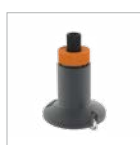
Kit supporto puntatore laser LKITA00000000093