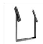
Kit torre faro extra LKITA00000000101