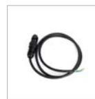
Cavo con connettore Ca. 2m, Con. 2 poli LKITA00000000040 Ca. 2m, Con. 3 poli LKITA00000000041