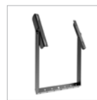
Kit torre faro extra LKITA00000000101