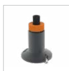
Kit supporto puntatore laser LKITA00000000093