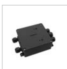
Kit scatola di derivazione LKITA00000100021