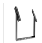
Kit torre faro extra LKITA00000000101