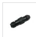
Connettore rapido IP 2 poli LKITA00000000017