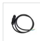
Cavo con connettore Ca. 2m, Con. 2 poli LKITA00000000040 Ca. 2m, Con. 3 poli LKITA00000000041