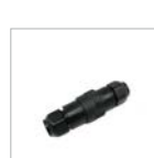
Connettore rapido IP 3 poli LKITA00000000003