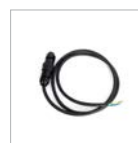
Cavo con connettore Ca. 2m, Con. 2 poli LKITA00000000040 Ca. 2m, Con. 3 poli LKITA00000000041