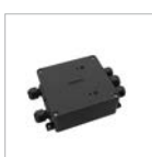
Kit scatola di derivazione LKITA00000100021