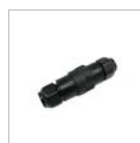
Connettore rapido IP 3 poli LKITA00000000003