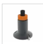
Kit supporto puntatore laser LKITA00000000093