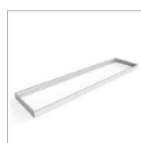
Struttura a plafone (295x1195) LKITA00000000025