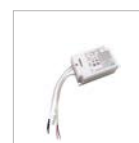
Driver DALI LKITA00000000087