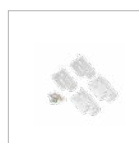
Kit montaggio a parete LKITA00000000026