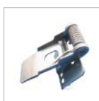
Molle per incasso a cartongesso LKITA00000000023