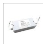
Kit Emergenza LKITA00000000086