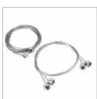
Kit sospensione LKITA00000000022