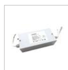
Kit Emergenza LKITA00000000086