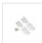
Kit montaggio a parete LKITA00000000026