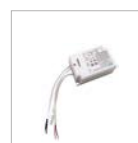
Driver DALI LKITA00000000087