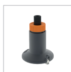
Kit supporto puntatore laser LKITA00000000093