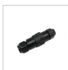
Connettore rapido IP 3 poli LKITA00000000003