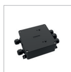
Kit scatola di derivazione LKITA00000100021