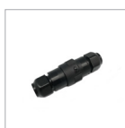
Connettore rapido IP 2 poli LKITA00000000017