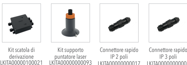
Kit scatola di derivazione LKITA00000100021 Kit supporto puntatore laser LKITA00000000093 Connettore rapido IP 2 poli LKITA00000000017 Connettore rapido IP 3 poli LKITA00000000003