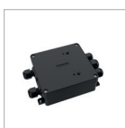
Kit scatola di derivazione LKITA00000100021