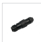
Connettore rapido IP 2 poli LKITA00000000017