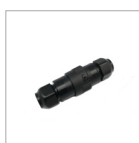
Connettore rapido IP 2 poli LKITA00000000017