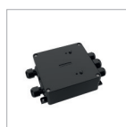
Kit scatola di derivazione LKITA00000100021