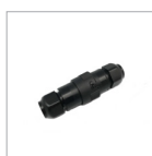
Connettore rapido IP 3 poli LKITA00000000003