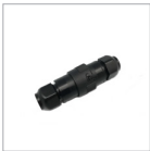
Connettore rapido IP 2 poli LKITA00000000017