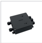
Kit scatola di derivazione LKITA00000100021