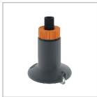
Kit supporto puntatore laser LKITA00000000093