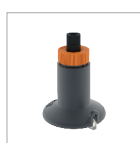
Kit supporto puntatore laser LKITA00000000093