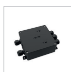
Kit scatola di derivazione LKITA00000100021