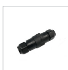
Connettore rapido IP 3 poli LKITA00000000003