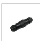
Connettore rapido IP 2 poli LKITA00000000017