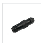
Connettore rapido IP 3 poli LKITA00000000003