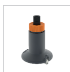
Kit supporto puntatore laser LKITA00000000093