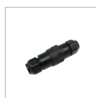
Connettore rapido IP 2 poli LKITA00000000017