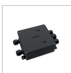
Kit scatola di derivazione LKITA00000100021