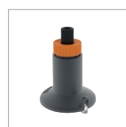
Kit supporto puntatore laser LKITA00000000093