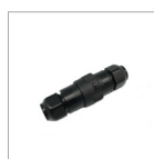
Connettore rapido IP 2 poli LKITA00000000017