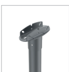
Raccordo testa palo B LKITA00000040109