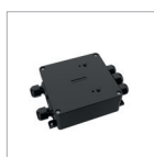
Kit scatola di derivazione LKITA00000100021