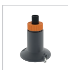
Kit supporto puntatore laser LKITA00000000093