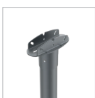
Raccordo testa palo B LKITA00000040109