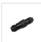
Connettore rapido IP 3 poli LKITA00000000003