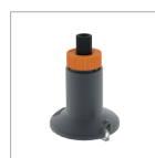
Kit supporto puntatore laser LKITA00000000093