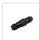
Connettore rapido IP 2 poli LKITA00000000017