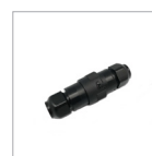
Connettore rapido IP 3 poli LKITA00000000003