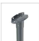
Raccordo testa palo B LKITA00000040109