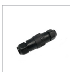
Connettore rapido IP 2 poli LKITA00000000017