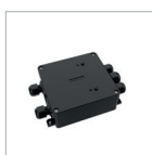
Kit scatola di derivazione LKITA00000100021