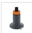
Kit supporto puntatore laser LKITA00000000093