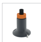
Kit supporto puntatore laser LKITA00000000093