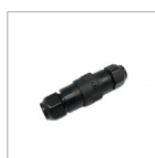
Connettore rapido IP 3 poli LKITA00000000003