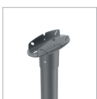
Raccordo testa palo B LKITA00000040109