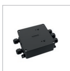
Kit scatola di derivazione LKITA00000100021