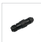
Connettore rapido IP 2 poli LKITA00000000017