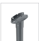
Raccordo testa palo B LKITA00000040109