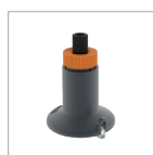
Kit supporto puntatore laser LKITA00000000093