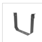
Kit parete/soffitto LKITA00000000016