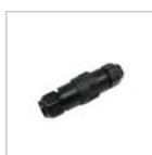
Connettore rapido IP 3 poli LKITA00000000003