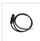
Cavo con connettore LKITA00000000040 LKITA00000000041