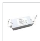
Kit Emergenza LKITA00000000095