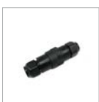
Connettore rapido IP 2 poli LKITA00000000017