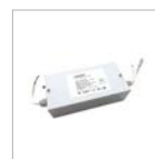
Kit Emergenza LKITA00000000095