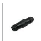
Connettore rapido IP 3 poli LKITA00000000003