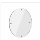
Vetro sodico calcico con distanziali LKITV00000000004