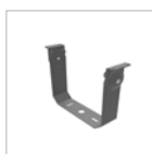
Kit parete/soffitto LKITA00000000015