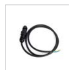
Cavo con connettore Ca. 2m, Con. 2 poli LKITA00000000040 Ca. 2m, Con. 3 poli LKITA00000000041