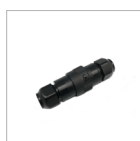
Connettore rapido IP 3 poli LKITA00000000003