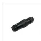
Connettore rapido IP 4 poli LKITA00000000018