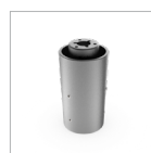
Kit raccordo palo Ø 60-80mm LKITA00000000064

LANZINI indica sui cataloghi il flusso luminoso uscente dell'apparecchio con una tolleranza ±10% rispetto al valore indicato. I W totali indicano la potenza totale assorbita dal sistema LED + alimentatore che non superi il 10% del valore indicato.