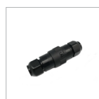
Connettore rapido IP 5 poli LKITA00000000103