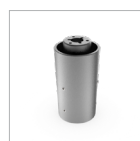
Kit raccordo palo Ø 60-80mm LKITA00000000064

LANZINI indica sui cataloghi il flusso luminoso uscente dell'apparecchio con una tolleranza ±10% rispetto al valore indicato. I W totali indicano la potenza totale assorbita dal sistema LED + alimentatore che non superi il 10% del valore indicato.