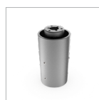
Kit raccordo palo Ø 60-80mm LKITA00000000064

LANZINI indica sui cataloghi il flusso luminoso uscente dell'apparecchio con una tolleranza ±10% rispetto al valore indicato. I W totali indicano la potenza totale assorbita dal sistema LED + alimentatore che non superi il 10% del valore indicato.