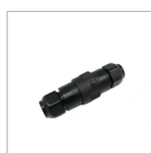
Connettore rapido IP 5 poli LKITA00000000103