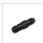
Connettore rapido IP 4 poli LKITA00000000018