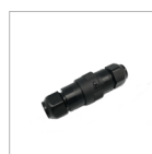
Connettore rapido IP 5 poli LKITA00000000103