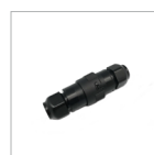
Connettore rapido IP 4 poli LKITA00000000018