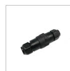
Connettore rapido IP 5 poli LKITA00000000103