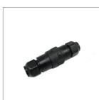
Connettore rapido IP 2 poli LKITA00000000017