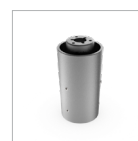
Kit raccordo palo Ø 60-80mm LKITA00000000064

Lanzini indica sui cataloghi il flusso luminoso uscente dell'apparecchio con una tolleranza ±10% rispetto al valore indicato. I W totali indicano la potenza totale assorbita dal sistema LED + alimentatore che non superi il 10% del valore indicato.