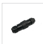
Connettore rapido IP 3 poli LKITA00000000003