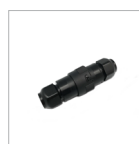
Connettore rapido IP 5 poli LKITA00000000103