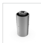
Kit raccordo palo Ø 60-80mm LKITA00000000064

Lanzini indica sui cataloghi il flusso luminoso uscente dell'apparecchio con una tolleranza ±10% rispetto al valore indicato. I W totali indicano la potenza totale assorbita dal sistema LED + alimentatore che non superi il 10% del valore indicato.