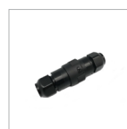
Connettore rapido IP 4 poli LKITA00000000018