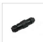
Connettore rapido IP 2 poli LKITA00000000017