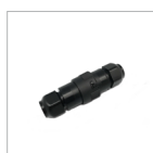
Connettore rapido IP 3 poli LKITA00000000003