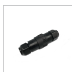
Connettore rapido IP 5 poli LKITA00000000103