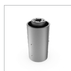
Kit raccordo palo Ø 60-80mm LKITA00000000064

LANZINI indica sui cataloghi il flusso luminoso uscente dell'apparecchio con una tolleranza ±10% rispetto al valore indicato. I W totali indicano la potenza totale assorbita dal sistema LED + alimentatore che non superi il 10% del valore indicato.