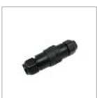
Connettore rapido IP 2 poli LKITA00000000017