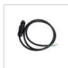
Cavo con connettore Ca. 2m/Co. IP 2 poli LKITA00000000040 Ca. 2m/Co. IP 3 poli LKITA00000000041