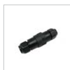
Connettore rapido IP 5 poli LKITA00000000103