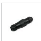
Connettore rapido IP 3 poli LKITA00000000003