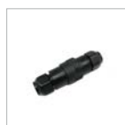
Connettore rapido IP 5 poli LKITA000000000103