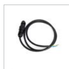
Cavo con connettore Ca. 2m/Co. IP 2 poli LKITA000000000040 Ca. 2m/Co. IP 3 poli LKITA000000000041