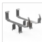
Kit attacco canalina 300 mm LKITA00000000009