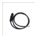
Cavo con connettore Ca. 2m, Con. 2 poli LKITA00000000040 Ca. 2m, Con. 3 poli LKITA00000000041