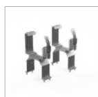
Kit attacco canalina 100 mm LKITA00000000007