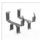
Kit attacco canalina 200 mm LKITA00000000008