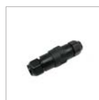
Connettore rapido IP 3 poli LKITA00000000003