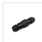
Connettore rapido IP 5 poli LKITA00000000013