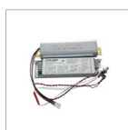
Kit Emergenza LKITA000000000083