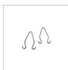
Kit sospensione LKITA000000000085