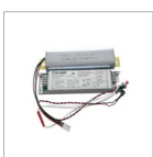
Kit Emergenza LKITA00000000083