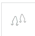
Kit sospensione LKITA00000000085