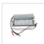
Kit Emergenza LKITA00000000083