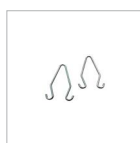
Kit sospensione LKITA00000000085