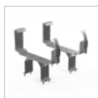
Kit attacco canalina 200 mm LKITA00000000011