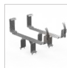
Kit attacco canalina 300 mm LKITA00000000012