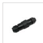
Connettore rapido IP 2 poli LKITA00000000017