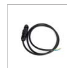
Cavo con connettore Ca. 2m, Con. 2 poli LKITA00000000040 Ca. 2m, Con. 3 poli LKITA00000000041