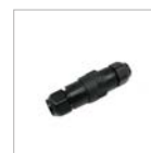
Connettore rapido IP 5 poli LKITA00000000013