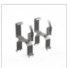
Kit attacco canalina 100 mm LKITA00000000010