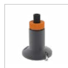
Kit supporto puntatore laser LKITA00000000093