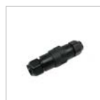
Connettore rapido IP 3 poli LKITA0000000003