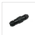
Connettore rapido IP 2 poli LKITA00000000017