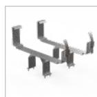
Kit attacco canalina 300 mm LKITA00000000012