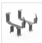
Kit attacco canalina 200 mm LKITA00000000011