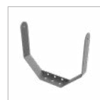
Kit staffa planare Ferro zincato LKITA00000000043 Inox LKITA00000000044