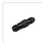
Connettore rapido IP 5 poli LKITA00000000013