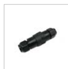
Connettore rapido IP 3 poli LKITA00000000003