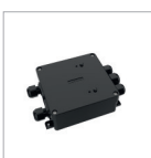
Boîte de jonction LKITA00000100021