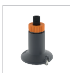
Kit de support pour pointeur laser LKITA00000000093