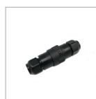
Connecteur rapide IP 3 pôles LKITA00000000003