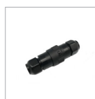
Connecteur rapide IP 2 pôles LKITA00000000017