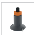
Kit de support pour pointeur laser LKITA00000000093