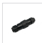
Connecteur rapide IP 3 pôles LKITA00000000003