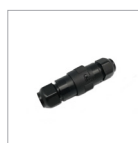
Connecteur rapide IP 2 pôles LKITA00000000017