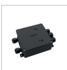
Boîte de jonction LKITA00000100021