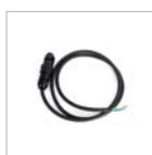
Câble avec connecteur LKITA00000000040 LKITA00000000041