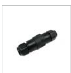
Connecteur rapide IP3 pôles LKITA00000000003