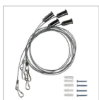
Suspension kit LKITA0000000188