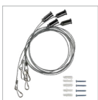
Suspension kit LKITA0000000188